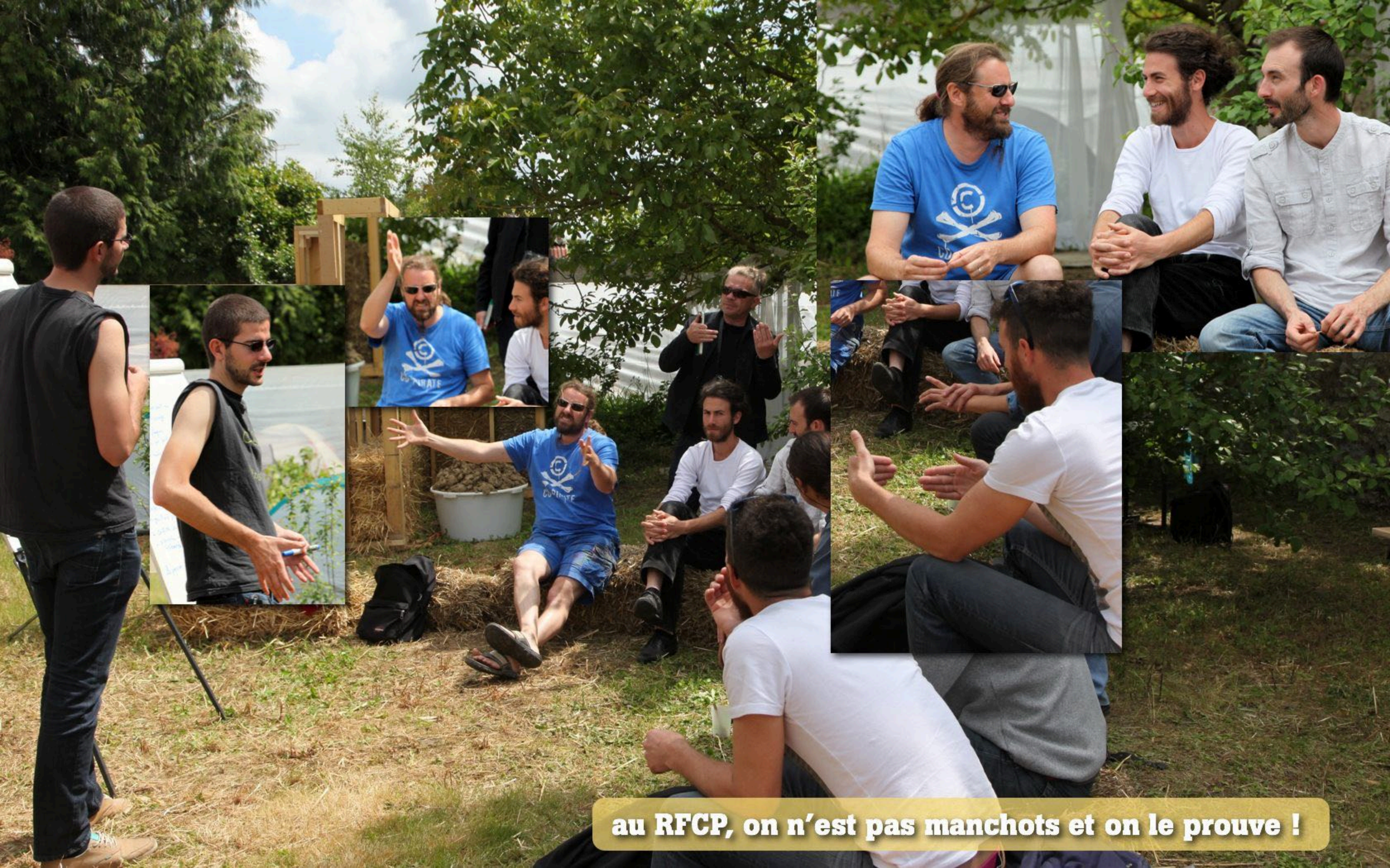
au RFCP, on n'est pas manchots et on le prouve !