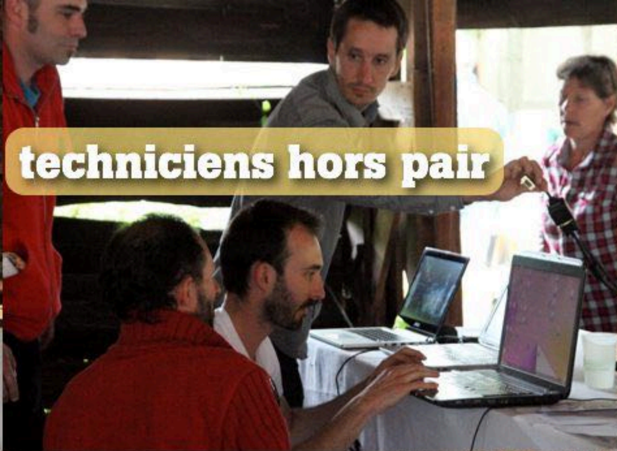
techniciens hors pair